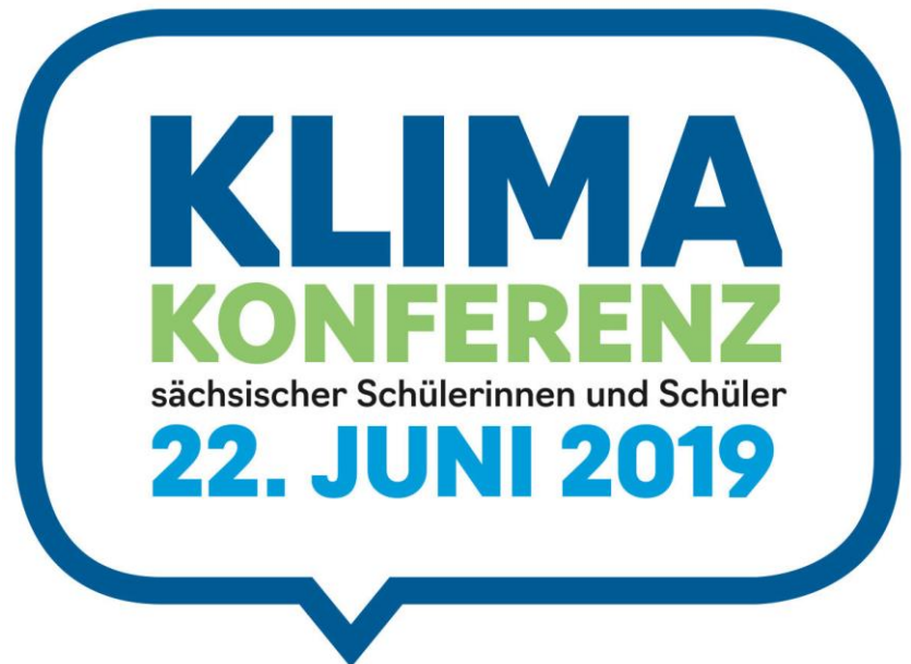
Foto des Monats

Das Foto des Monats zeigt immer ein Ereignis, das für uns als Kreisschülerrat einen besonderen Stellenwert eingenommen hat.